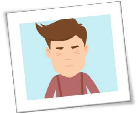
Un constat alarmant