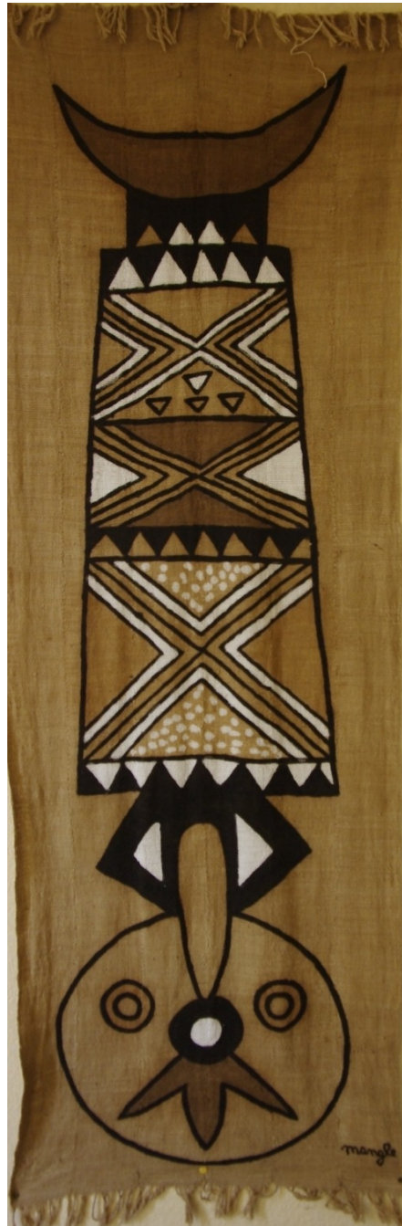
Bogo : la terre Lan : mettre