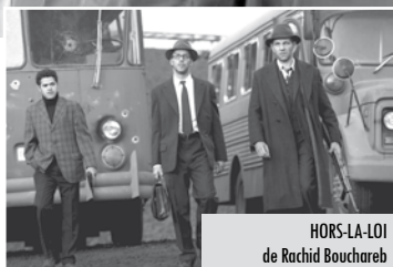
HORS-LA-LOI de Rachid Bouchareb