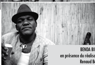
BENDA BILLILI ! en présence du réalisateur Renaud Barret