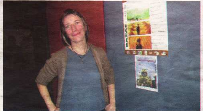
« Autres sons de cloches » retrace la vie du petit village de Brouqueyran marqué par un événement extraordinaire.

La fonte des cloches. « Quel rôle joue la fonte d'une nouvelle cloche pour les habitants d'un village ? » s'est demandée Emmanuelle Troy. « Ils se lancent d'abord un défi : cela se fait ail-