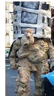
Cie Mouton de Vapeur

À nous de les découvrir au gré d'une promenade « nature » dans les lieux boisés du bourg de Sabres.