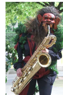
les Z'Hurlis d'Bruits